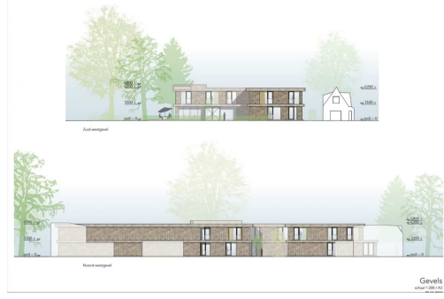
Gevels niveau: 0.00, 1.50, 3.00, 4.50