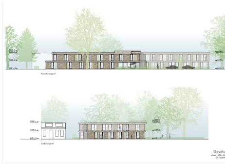
Gevels niveau: 0.00, 1.50, 3.00, 4.50