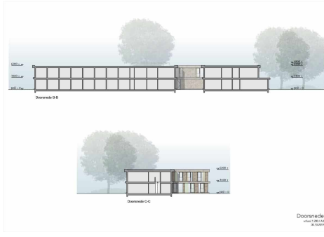
Doorsede niveau: 0.00, 1.50, 3.00, 4.50